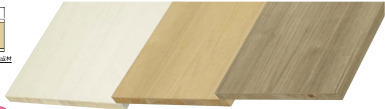
ホワイトチェリー ブライトウォールナット アッシュウォールナット